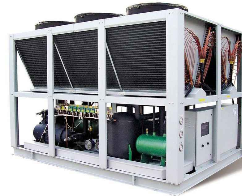
Folyadékűtő Hűtési teljesítmény (250 kW)